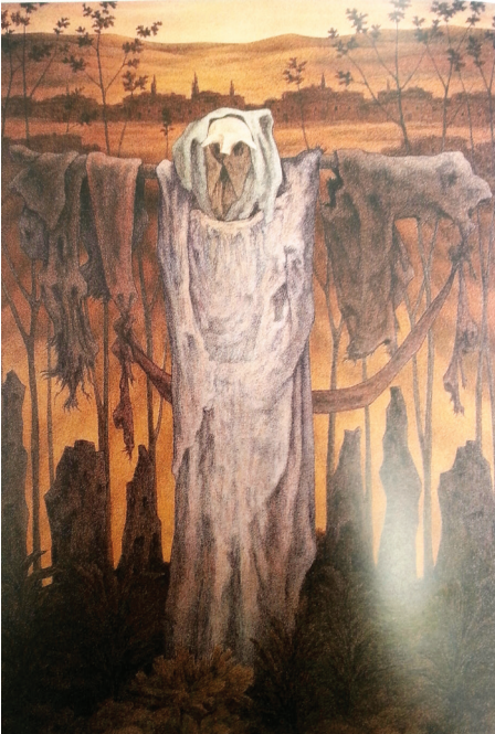
Resim 8: Korkuluk VI, T.Ü.Y.B.165x114 cm.1988

Resim 7'de de korkuluğun elleri önden birleştirilmiş şekilde bir sopanın ucunda at başı iskeleti tutar biçimde görülmektedir. At başı Anadolu'da nazara karşı bağ, bahçe ve evlerin duvarlarına asılmaktadır. Mekânın ıssızlığı ve korkuluğun dibinde büzülmüş otaran çocuk, bu ıssız mekâna daha dramatik bir anlatım vermektedir.