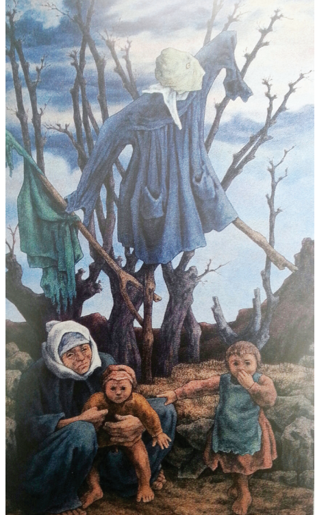
Resim 6: Korkuluk VIII, T.Ü.Y.B.184x112 cm.1988 (Özel Koleksiyon)

reden bir başka çocuk, ayakta durarak yüzü izleyiciye dönük en büyükleri olduğu düşünülen bir başka çocuk yer almaktadır. Resimde annenin çocuklarını korumak üzere eğilmiş duruşunda dramatik bir anlatım söz konusudur.