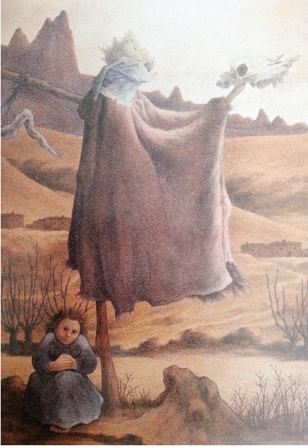
Resim 7: Korkuluk IV, kâğıt üzerine karışık teknik