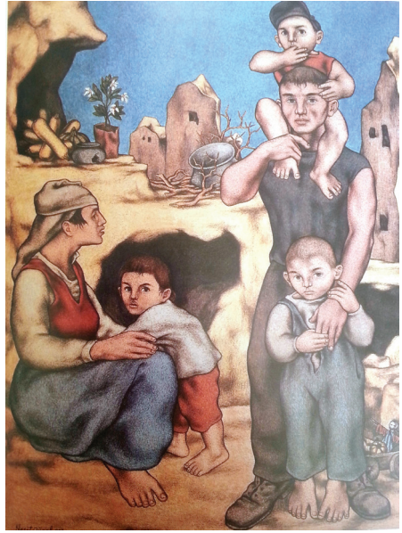
Resim 1: Yaşantı I, T.Ü.Y.B.185x140 cm.1958 (Sabancı Koleksiyonu)

1958 yılında yaptığı Yaşantı 1 adlı resimde sadece bir detayı görülen (resim 2) oyuncak korkuluk, daha sonra 1980'lere damgasını vuran bir dizi resim olarak karşımıza çıkar. Yaşantı 1 adlı (resim 1) resimde sağ alt köşede görülen oyuncak korkuluk, Günal'ın yaşamı boyunca bilinçaltında yaşadığı korkularla özdeşleştirdiği korku imgesini korkuluklara atfederek yansıttığı ilk resmidir. Kendi ifadesiyle tüm resimleri arasında en fazla itibar ettiği bu resimler, eserleri arasında önemli bir yere sahiptir.