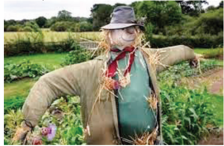
Tarla kenarından çekilmiş bir korkuluk fotoğrafı (Sanal 1)

da deşebileceğine inanmış, bağ ve bahçelerini nazardan korumak için bostan korkuluğu ya da kazıklara geçirilmiş at kafası dikmişlerdir. Bununla ilgili olarak Kaşgarlı Mahmut'un eserinde "bostan korkuluğu" anlamına gelen "abakı" (Divanü Lûgat-it-Türk, I, 136-22) ve "göz deşmesinden sakınmak için üzüm bağlarına ve bostanlara dikilen nazarlık" şeklinde açıklanan "köşgük" (Divanü Lûgat-it-Türk, II, 289-18, 289-23) kelimelerine rastlanmaktadır.