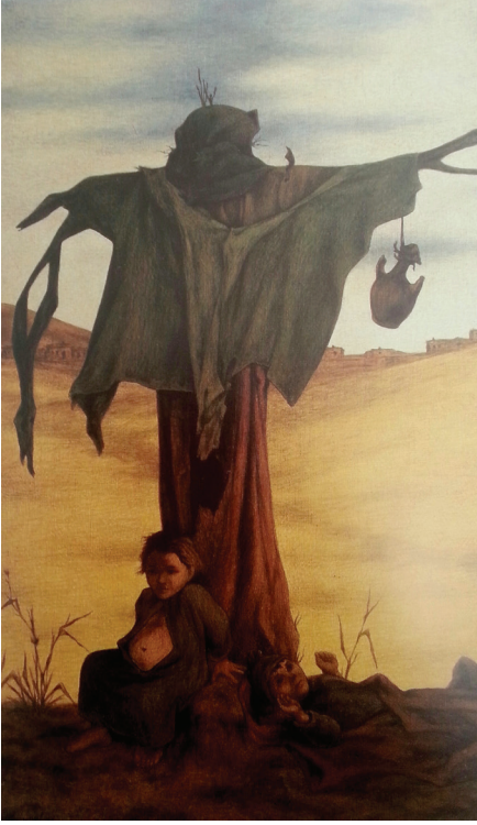
Resim 3: Korkuluk I, T.Ü.Y.B., 220x165 cm. 1968 (Mimar Sinan Ün. Resim-Heykel Müzesi)

Korkuluk I adlı resimde (Resim 3) ise korkuluğun, ürkütücü bir şekilde resmedildiği görülmektedir. Korkuluğun koluna asılmış olan testi, Anadolu'nun bazı yerlerinde özellikle İç Anadolu'da nazara karşı çocukların boynuna asılan nazardan koruma imgelerinden biridir. Korkuluğun dibinde ise oturmaktan ziyade sinmiş gibi görülen karnı açık yoksul giysisi içinde bir çocuk yer almaktadır. Kargaları ya da başka hayvanları korkutmak amacıyla dikilmiş olan korkuluğun çocuğu da korkuttuğu izlenimi vermektedir. Korkuluğun gölgesine yatırılmış ikinci bebek muhtemel tarlada çalışan annesinin gölgede yatması için bıraktığı küçük çocuğudur.