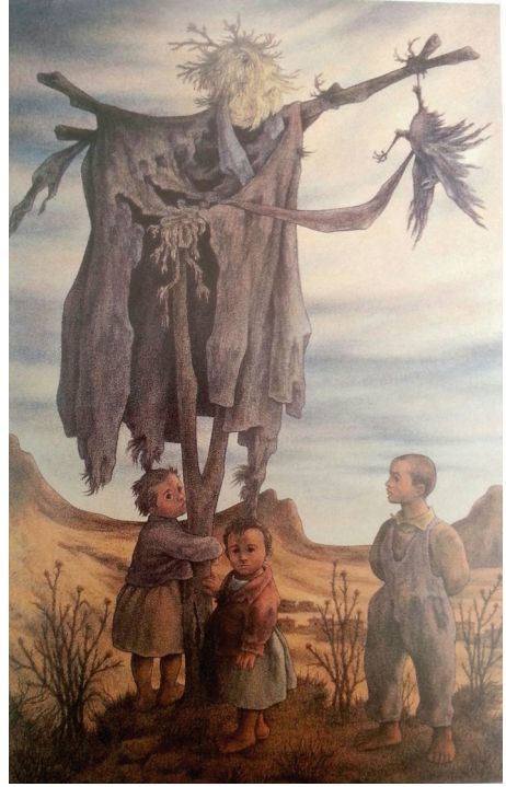
Resim 4: Korkuluk II, T.Ü.Y.B., 184x116 cm. 1986

Korkuluk I adlı resimde (Resim 3) ise korkuluğun, ürkütücü bir şekilde resmedildiği görülmektedir. Korkuluğun koluna asılmış olan testi, Anadolu'nun bazı yerlerinde özellikle İç Anadolu'da nazara karşı çocukların boynuna asılan nazardan koruma imgelerinden biridir. Korkuluğun dibinde ise oturmaktan ziyade sinmiş gibi görülen karnı açık yoksul giysisi içinde bir çocuk yer almaktadır. Kargaları ya da başka hayvanları korkutmak amacıyla dikilmiş olan korkuluğun çocuğu da korkuttuğu izlenimi vermektedir. Korkuluğun gölgesine yatırılmış ikinci bebek muhtemel tarlada çalışan annesinin gölgede yatması için bıraktığı küçük çocuğudur.