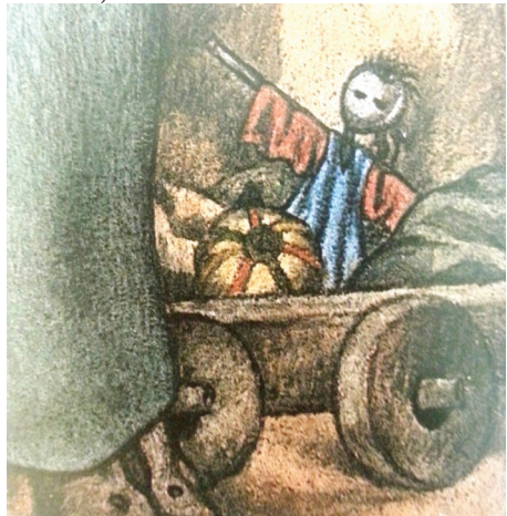
Resim 2: Yaşantı 1 adlı resimden detay

Anadolu insanının ve onun çocukluk yıllarında çokça gördüğü korkuluk konulu resimleri; "... Rüzgarda çırpınan korkulukların altında yattığım çocukluk dönemlerimin korkuyu yenme çabasıyla yaşadığım anılarımda gizli" diye ifade ettiği eserleridir (Ergüven, 1996: 9).