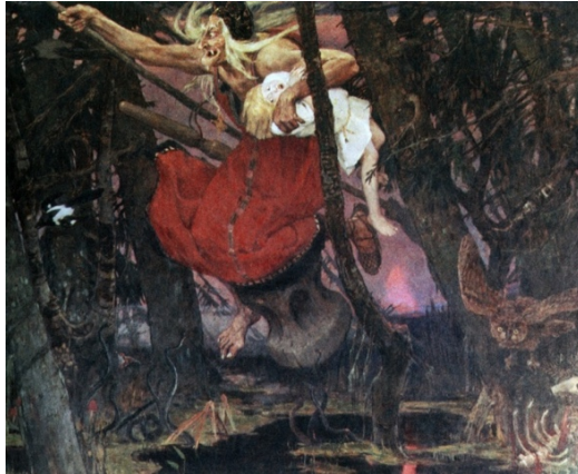
Resim 2. Baba Yaga, Viktor Vasnetsov, 1917.

Derlenen masalarda daha çok gaddarlığı, biçimsiz, iri cüsseli fiziğiyle tasvir edilen Dev Anası ise, Baba Yaga gibi mitolojik temelli bir masal kahramanıdır (Yücel 1998: 38-39; Sarpkaya 2017: 64; Bahadır 2019: 123; Yılmaz 2022: 167; Özdemir 2022: 159). Devler konusu genel olarak incelememizin temelini oluşturmadığından çalışma çerçevesinde ayrıntılı olarak ele alınmamaktadır. Buna karşılık konu bakımından çalışmamız için önem arz ettiğinden sadece dışı dev karakteri üzerinde durulmuştur. Gerçekleştirilen çalışmalarda devlerin iyi ve kötü huylu olmak üzere iki ana grupta toplandıkları görülür (Yücel 1998: 38; Bahadır 2019: 122). Bilhassa Dev Anası karakterinin iyi özelliklerinin görüldüğü ve kahramana yardımcı olduğu noktalar, Rus masal kahramanı Baba Yaga ile benzerlik gösteren yanlarını oluşturmaktadır. Bu bakımdan Dev Anası, Baba Yaga ile arketip özelliği sergilediğinden ötürü masalarda yer eden benzerlikleri üzerinde durulmuştur. Kimi zaman Dev Karısı olarak da ifade edilen Dev Anası masalarda Baba Yaga'nın oynadığı rolü oynar. Görünüm olarak benzer yanları bir hayli fazladır. Dev Anası tıpkı Baba Yaga gibi biçimsiz bir dış görünüşe sahiptir.